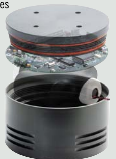
Analizador de Tráfico Permanente Groundhog